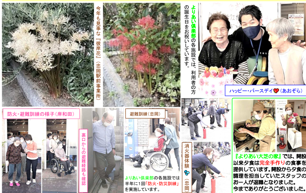
今年も見事な『彼岸花』 (忠岡駅前事業所)