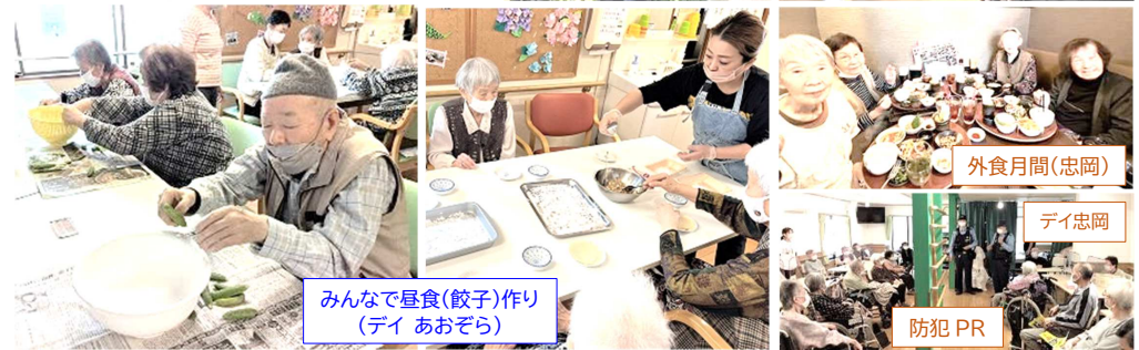
みんなで昼食(餃子)作り (デイ あおぞら)