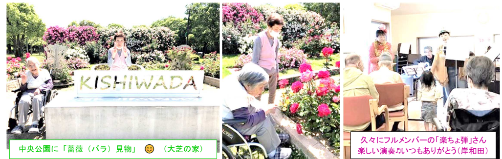
中央公園に「薔薇(バラ)見物」 (大芝の家)