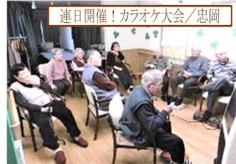
連日開催!カラオケ大会/忠岡