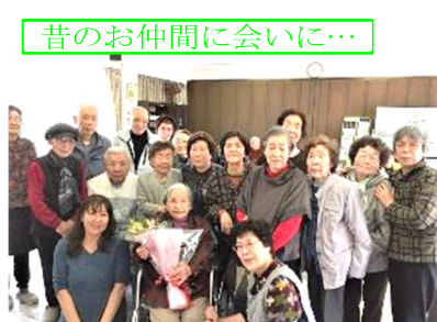
昔のお仲間へ会いに...

♡「大芝の家」では、「夢叶えます」実施中です。入居者の方の希望を出来るだけ叶えられるように、いろいろな方の協力を得て、随時実行中です。下の写真は、3月中に行われた「夢叶えます」の様子です。♡