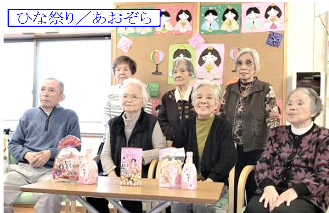
ひな祭り/あおぞら