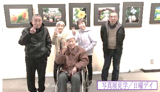
写真展見学/日曜デイ