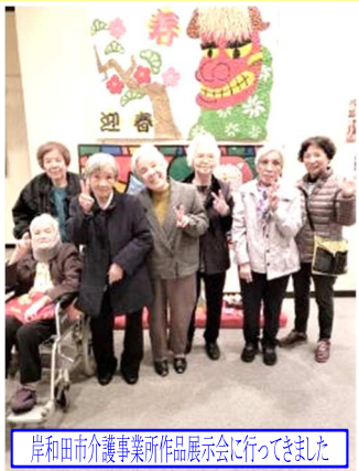
岸和田市介護事業所作品展覧会に行ってきました