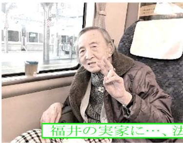
福井の実家に...、法事に出席できました