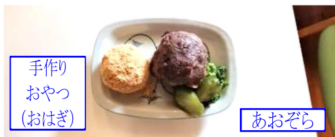
手作りおやつ(おはぎ)