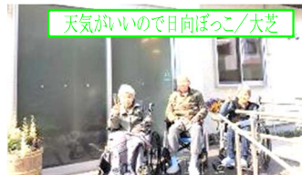
天気がいいので日向ぼっこ/大芝